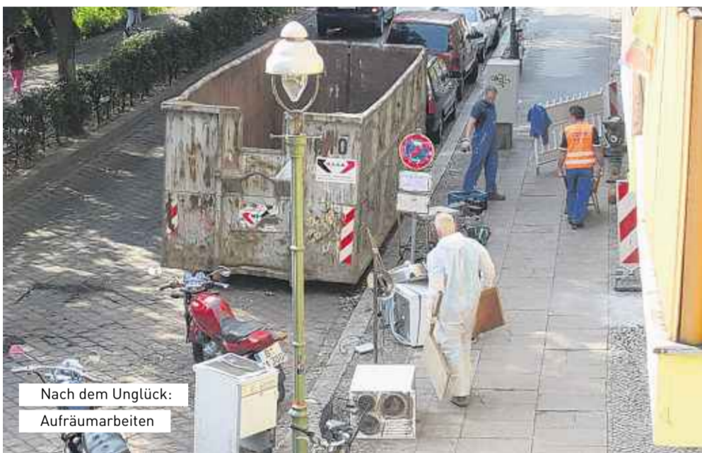
Nach dem Unglück: Aufräumarbeiten

Weitere Informationen http://pankegeschadigte.wordpress.com